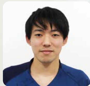
講師： 動物先端医療センター・AdAM 看護師長

動物先端医療センターAdAM 3F セミナールーム 〒411-0934 長泉町下長窪1075