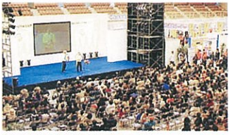
▲ねんりんピックいばらき2007