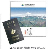
▲伊豆の国市パスポート、パンフレット