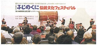
▲ふじのくにに伝統文化フェスティバル