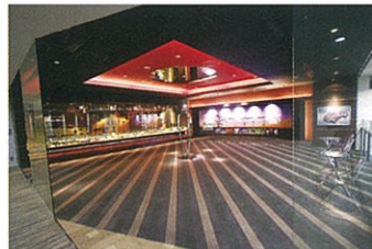
▲矢崎総業大阪支店ショールーム