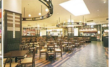
▲サントムーン柿田川リニューアル