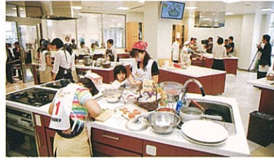
▲全国親子クッキングコンテスト静岡県大会