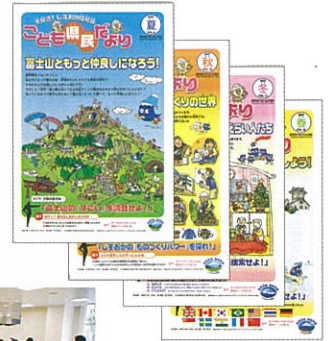
▲こども県民だより