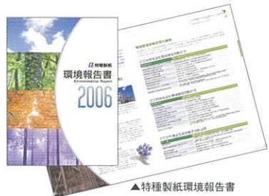
▲特種製紙環境報告書