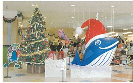
▲ウェルディ長泉 Xmas装飾