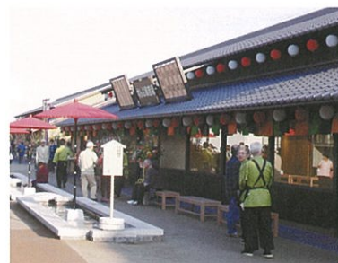
▲すんぷ夢ひろば すんぷ演芸場