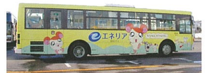
▲静岡ガスエネリア ラッピングバス