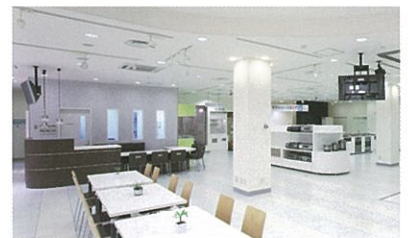
▲静岡ガスエネリア 静岡ショールーム