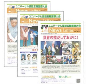
▲ユニバーサル技能五輪国際大会ニュースレター