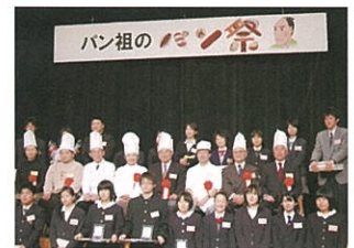
▲伊豆の国市「パン祖のパン祭」