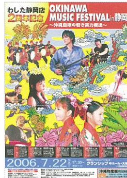
▲OKINAWA MUSIC FESTIVAL in静岡ポスター