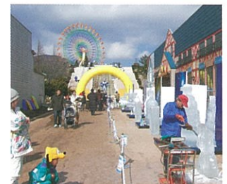
▲フジヤマリゾートぐりんぱ「アイスフェスタ」