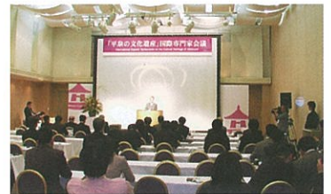
▲「平泉の文化遺産」国際専門家会議