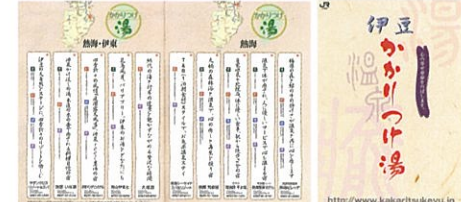
▲「かかりつけ湯」パンフレット