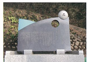
▲韮山高等学校野球部OB会石碑