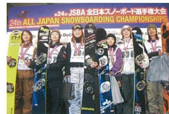
▲JSBA全日本スノーボード選手権大会