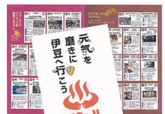
▲伊豆市まるごと「TO-JI」博覧会パンフレット