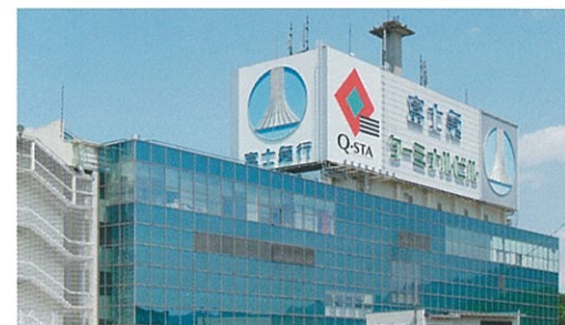
▲富士吉田富士急ターミナルビル「Q-STA」