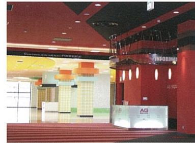
▲AGスクエア水戸 店内